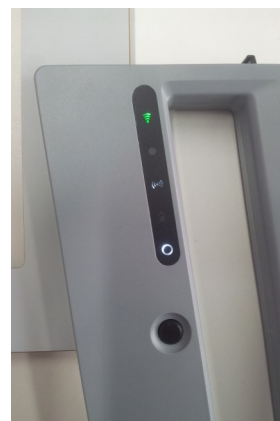
EasyMobileStation-H50 — LEDs

Je nach Typ und Leseabstand der Medien lässt sich die Ausgangsleistung zwischen 2 Leistungsstufen (Standard- und Boost Mode) umschalten. Die Spannungsversorgung erfolgt über eine leistungsfähige wiederaufladbare Batterie (Akku). Diese erlaubt Betriebszeiten zwischen ca. 8 bzw. 16 Stunden. Bei Bedarf ist das Auswechseln auf einen zweiten Akku einfach und schnell möglich.